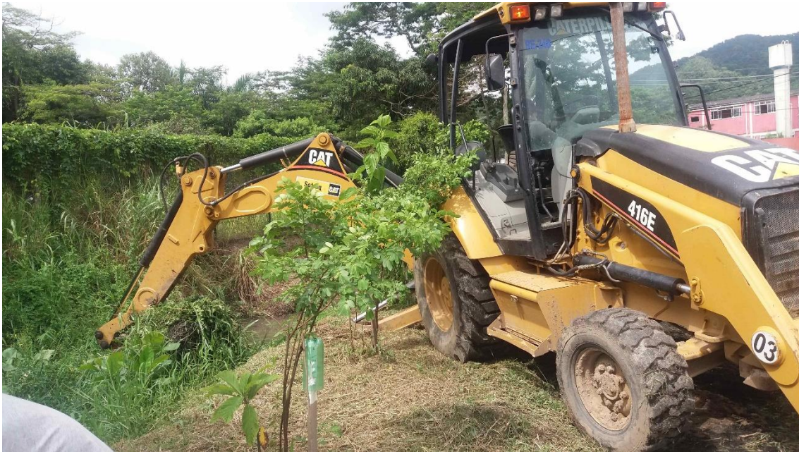
Figura 9 – Uso de máquinas pesadas para remoção do mato do córrego causando destruição das margens.

Estes trabalhos foram realizados pela última vez em 5 de fevereiro de 2020. Depois nunca mais foram necessários.