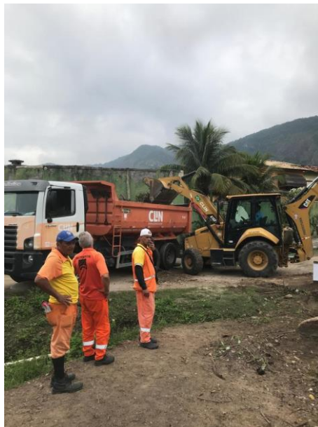
Figura 4 - Mutirão para remoção do lixão ao final da Av. Boa Vista

Foram realizados Seis mutirões mensais até que o sétimo foi cancelado devido a pandemia global de COVID 19. No período da COVID o grupo manteve contato por meio de reuniões virtuais. Após a COVID foram organizados mais 12 mutirões. Sendo os iniciais para complementar o plantio e outros para trabalhos de limpeza e manejo. A partir do Mutirão 11 se iniciou a remoção, com ajuda da CLIN de um grande lixão que se havia forma no trecho final da Avenida Boa Vista (Figura 4). Este trecho atualmente se está fazendo o plantio com a remoção de espécies invasoras.