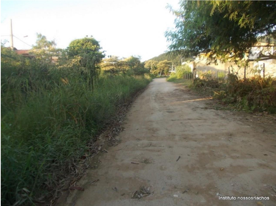
Figura 5 – Situação da margem esquerda do Córrego dos antes da intervenção