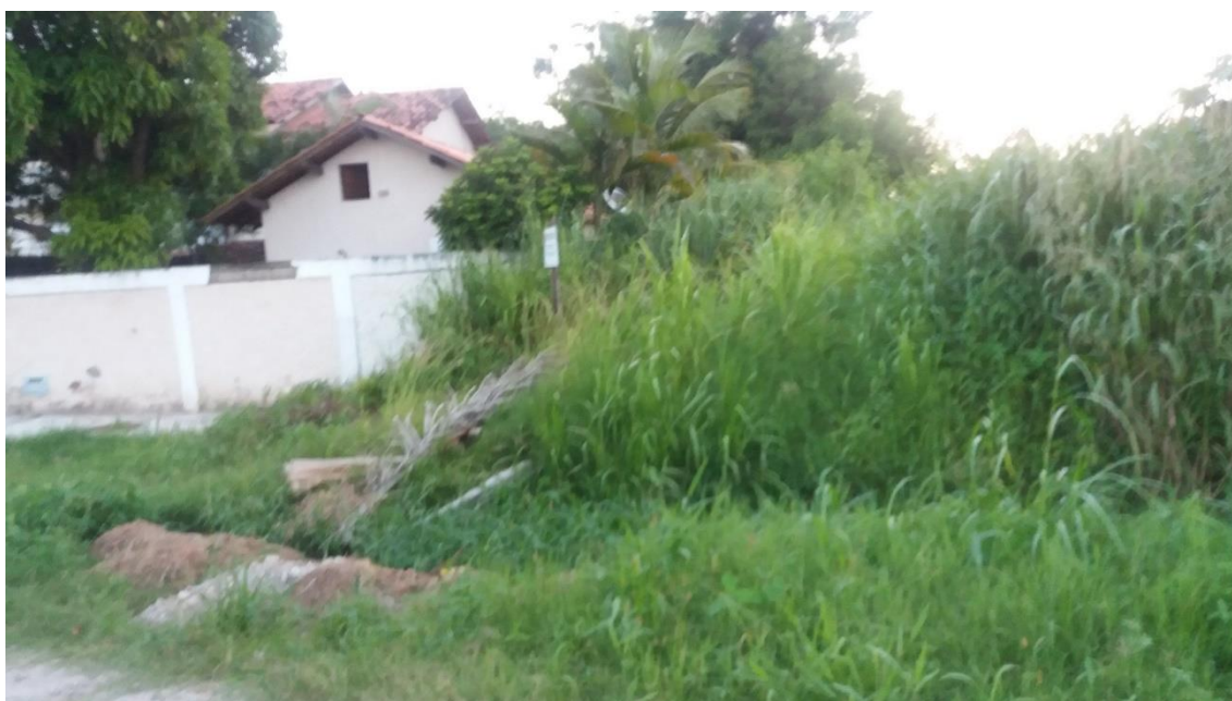
Figura 11 – Trecho 5 com mato cerrado impedindo o acesso até a Lagoa.

O quinto trecho com aproximadamente 190m vai até a lagoa. Este trecho está inacessível pela falta de caminho e mato alto (fig. 12). Será necessário liberar o caminho para avaliar a área em que começa a vegetação de mangue.