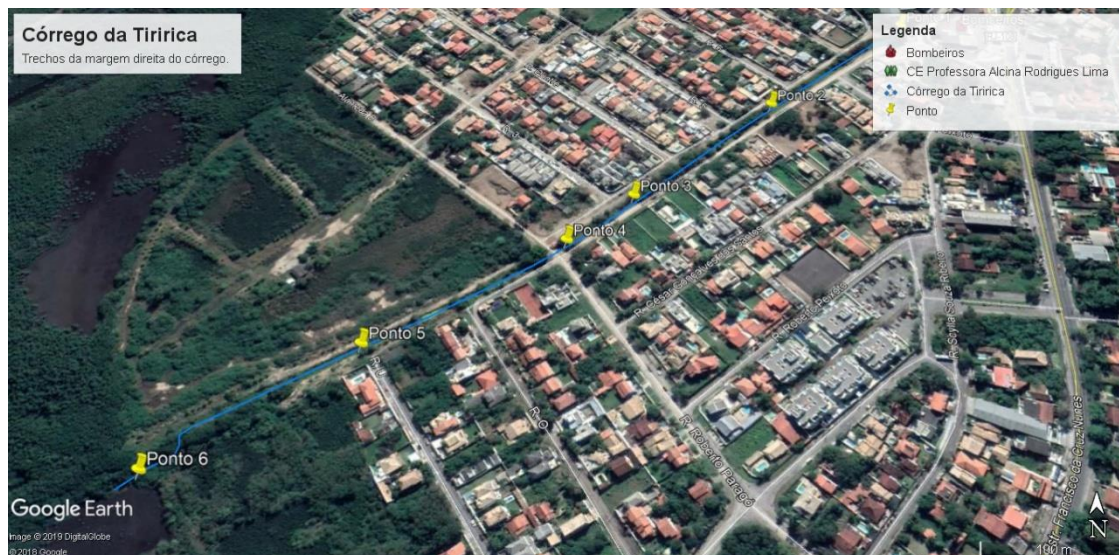
Figura 6 – Representação em vista aérea dos trechos do córrego

O primeiro trecho de aproximadamente 180 m está quase totalmente tomado por mato alto (fig. 7). Neste trecho será necessário antes do plantio das mudas a capina e incorporação do mato ao terreno. Algumas partes com ameaça de desbarrancamento precisaram de tratamento especial.