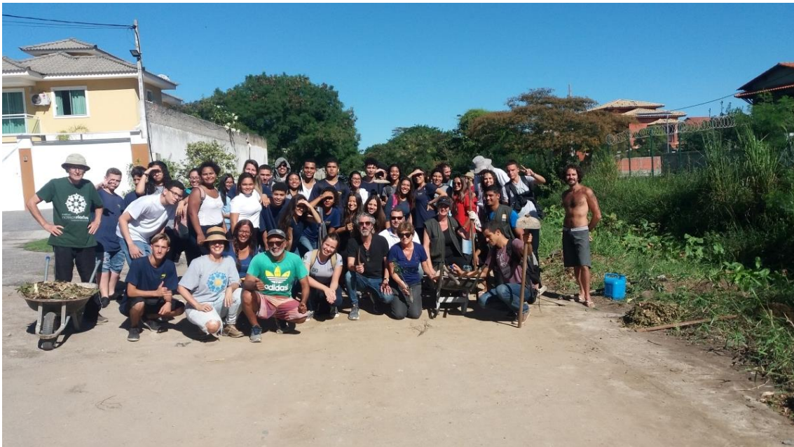
Figura 2 –Mutirão na Semana do Meio Ambiente de Niterói.