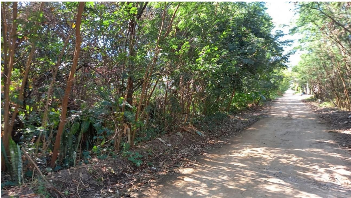
Figura 6 – Situação do mesmo trecho acima após quatro anos de projeto.

Entre as diversas melhoras atingidas pelo Projeto até um momento, uma delas nos surpreendeu. Anualmente havia a necessidade de remoção do mato que cobria o córrego (Figura 7).