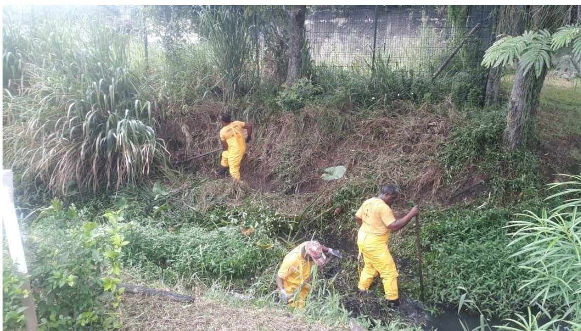
Figura 8. Trabalhadores que eram necessários para remover o mato e desta forma interferir com a biodiversidade natural deste ambiente.

Mesmo estes homens não tinham força para retirar o mato de dentro do córrego, obrigando o uso de máquinas pesadas que acabavam provocando grandes desmoronamento das margens (Figura 9).