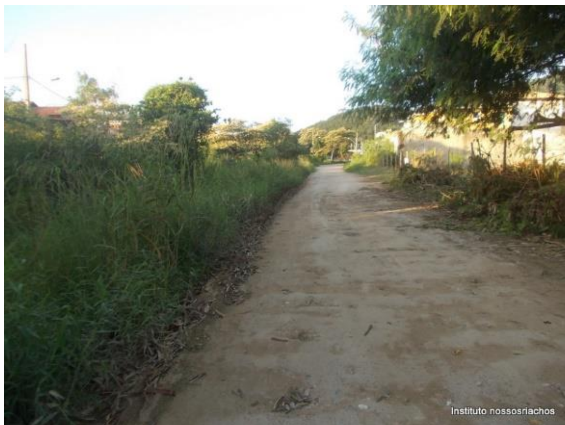
Figura 7 – Trecho 1 ocupado quase totalmente por mato, visto do final do trecho para a Av. Francisco Nunes.

O primeiro trecho de aproximadamente 180 m está quase totalmente tomado por mato alto (fig. 7). Neste trecho será necessário antes do plantio das mudas a capina e incorporação do mato ao terreno. Algumas partes com ameaça de desbarrancamento precisaram de tratamento especial.