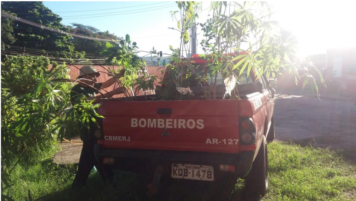
Figura 3 – Mudas cedidas pelo PESET e armazenadas nos Bombeiros até o dia do Mutirão.

Foram realizados Seis mutirões mensais até que o sétimo foi cancelado devido a pandemia global de COVID 19. No período da COVID o grupo manteve contato por meio de reuniões virtuais. Após a COVID foram organizados mais 12 mutirões. Sendo os iniciais para complementar o plantio e outros para trabalhos de limpeza e manejo. A partir do Mutirão 11 se iniciou a remoção, com ajuda da CLIN de um grande lixão que se havia forma no trecho final da Avenida Boa Vista (Figura 4). Este trecho atualmente se está fazendo o plantio com a remoção de espécies invasoras.