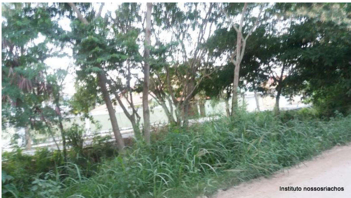
Figura 9 – Trecho 3 com mato e árvores isoladas.

O terceiro trecho com aproximadamente 70 está também coberto com mato, mas apresenta algumas árvores de extrato alto com bom desenvolvimento (fig.9). Será necessário a capina e plantio de espécies de extratos médio e baixo