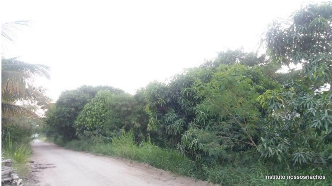
Figura 8 – Trecho 2 já bem arborizado com plantas bem desenvolvidas

O segundo trecho de aproximadamente 170 m está bastante arborizado com árvores já bem desenvolvidas (fig. 8). Neste trecho entre outras árvores haviam mangueiras, jambeiro, amendoeira e sombreiro. Será necessário a poda das árvores, capina e plantio de espécies de extratos médio e baixo.