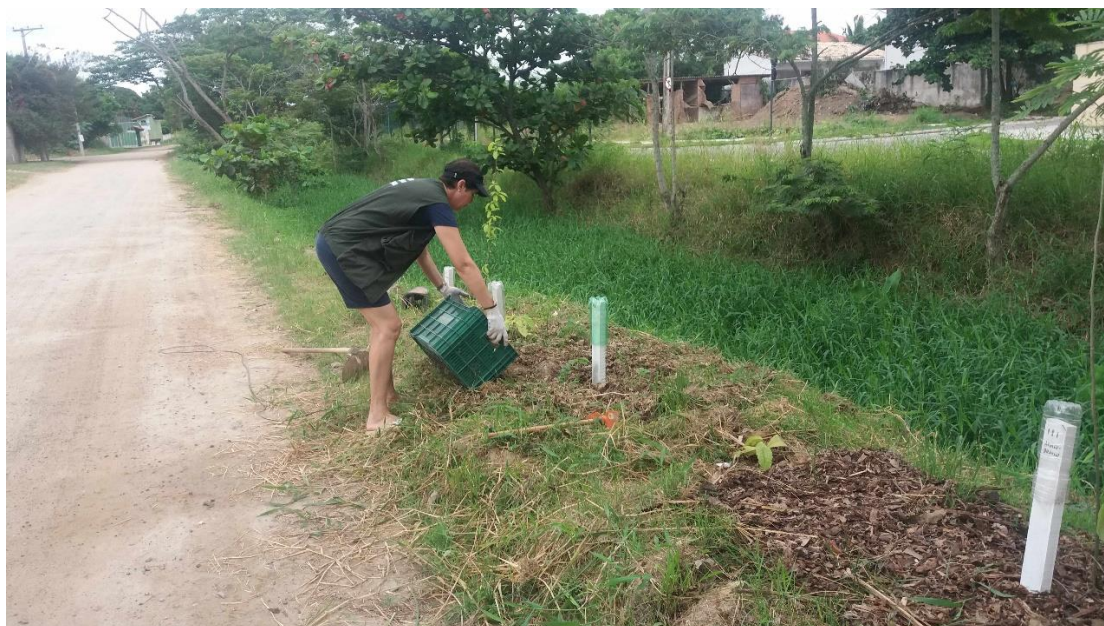
Figura 7. Sem proteção da mata ciliar anualmente o mato cobria completamente o córrego. Então era necessária a utilização de um grande número de trabalhadores para remoção deste mato (Figura 8).