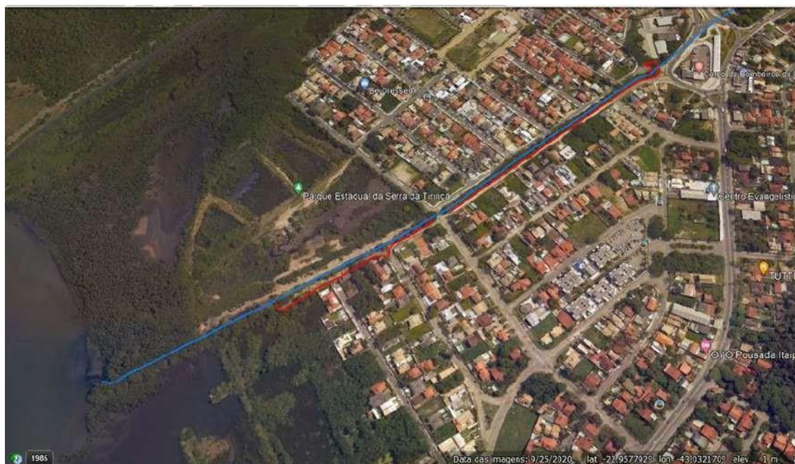
Figura 1. (A) Microbasins do sistema lagunar Itaipu-Piratininga, com representação de seus nove córregos e indicação dos principais contribuintes (rio Jacaré e rio João Mendes). Eco-barreira do rio João Mendes e localização do trecho de recuperação vegetal no córrego dos colibris, com nascentes no parque estadual da Serra da Tiririca. Adaptado da Carta Topográfica Matricial Baía de Guanabara SF-23-Z-B-IV-4 de 1:50.000. (B) Imagem de satélite com o local de recuperação da vegetação ripária (vista do Google Earth).