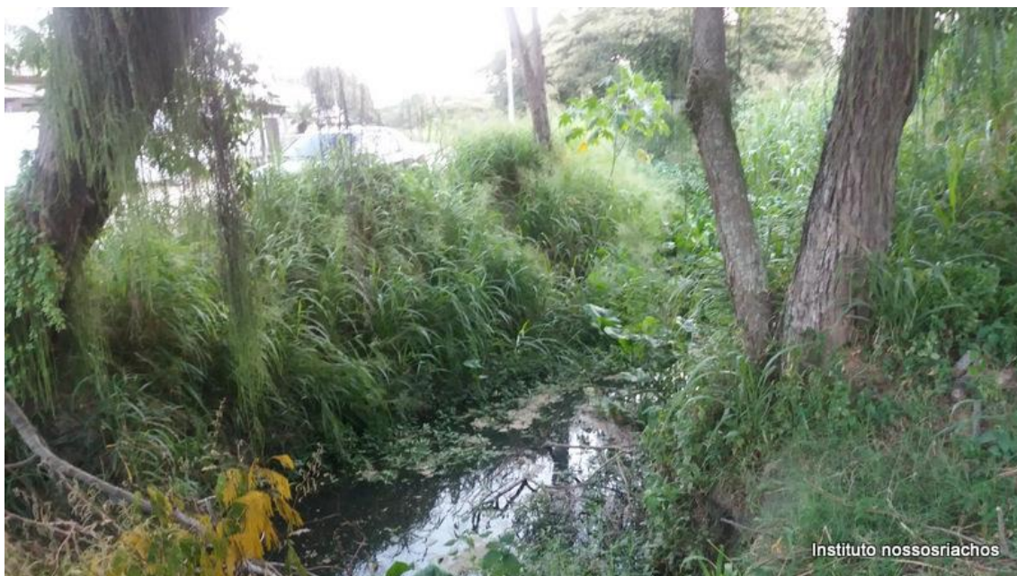
Figura 4 – Início do canal aberto do córrego da Tiririca.

Córrego da Tiririca. Nasce na Serra da Tiririca, no contraforte do Morro do Telégrafo, a 200 metros de altitude. Com o nome de córrego dos Colibris, desce da nascente, pelo Parque Estadual da Serra da Tiririca, até seus limites na Rua Scylla Souza Ribeiro. A partir deste trecho segue por canalização subterrânea, passando pelo Bairro Peixoto até a Escola Professora Alcina, onde desaguava inicialmente. Deste ponto segue canalizado (fig.4), por aproximadamente 800m até seu novo ponto de deságue na Lagoa. Este desvio foi construído para dar lugar a construção do Bairro Boa Vista. É um córrego temporário, ou seja depende do regime de chuvas. No total tem um percurso de 2.500 m até desembocar na Lagoa da Itaipu.