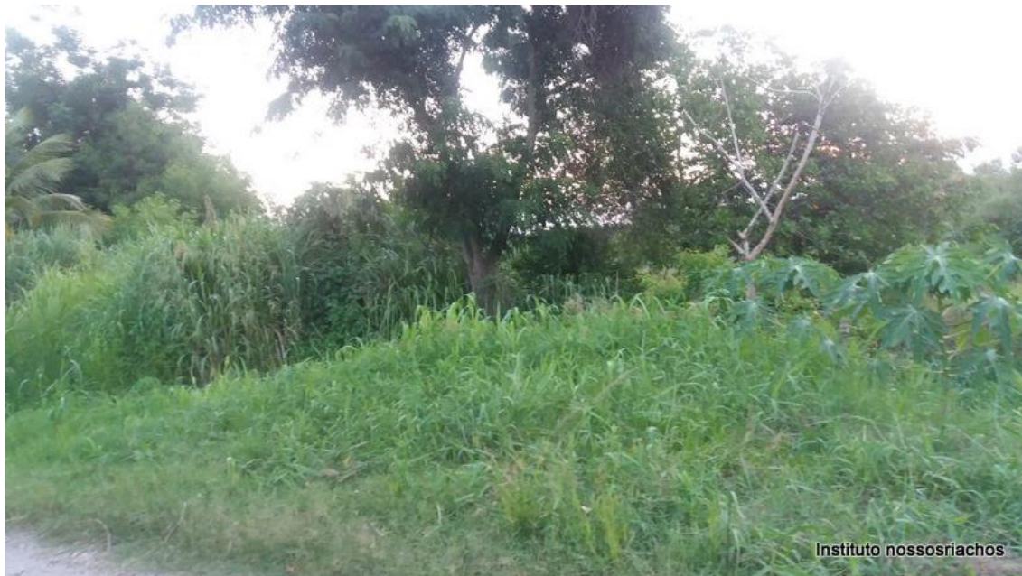
Figura 10 – Trecho 4 com mato alto e algumas espécies frutíferas.

O quarto trecho com aproximadamente 190m vai até o final da Av. Boa Vista. Neste trecho registramos a presença de bananeiras, acerola e coqueiro, e mato alto. (fig. 10). Será necessário a poda das árvores, capina e plantio de espécies de extratos alto e baixo.